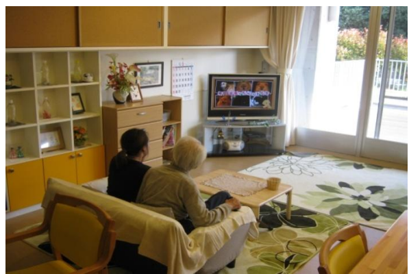
リビングでくつろぐ入居者様と施設職員 — めぐみ街リビング —

社会福祉法人 齊俱会 特別養護老人ホーム 西之島の郷 ☎0538>39-4165