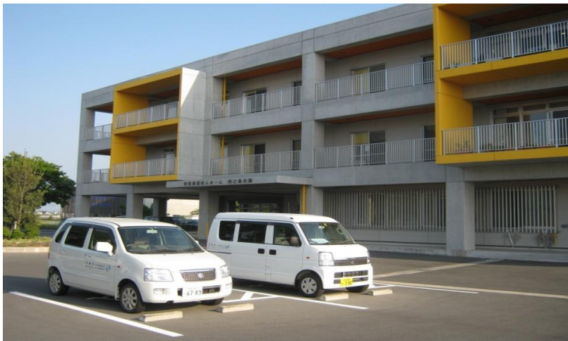
写真は特別養護老人ホーム西之島の郷 — 磐田市西之島26番地1 —

短入所生活介護施設 西之島の郷 施設開設以来、西之島の郷では、高齢者の生活の質を向上させることを目指して、様々な取り組みを行っています。特に、認知症の予防や、生活リズムの改善に力を入れています。また、地域との交流を促進し、高齢者が安心して生活できる環境を整えています。今後も、高齢者の生活の質を向上させるために、様々な取り組みを続けてまいります。