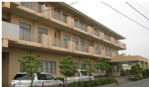
社会福祉法人ほなみ会 特別養護老人ホーム南風

社会福祉法人 齊慎会 特別養護老人ホーム 西之島の郷 ☎0538>39-4165