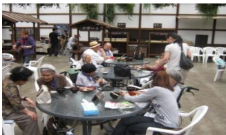
バイキングでの食事の様子