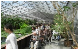
園内を見学している様子

昨年から実施している短期入所施設西之島の郷の遠足ですが、今年は六月十三日に実施することになりました。場所は昨年と同じ掛川花鳥園となります。昨年はご利用日の都合で参加出来なかつた方や昨年も行つたけどまた行きたいという方まで、皆様のご参加を心よりお待ちしております。