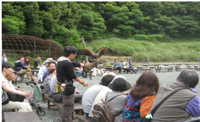
昨年の遠足での様子